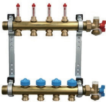
美观实用的分集水器