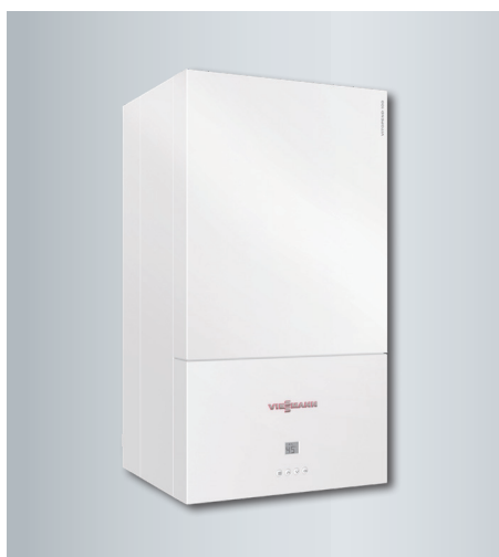
Vitopend 100-C A1JP