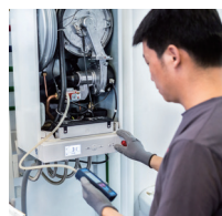
维护和保养特别简便