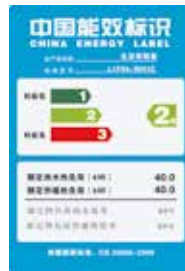
节能并保护环境 被划归为低温供热锅炉