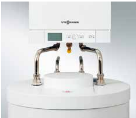
连接组件——用于下置式换热水箱 Vitopend 100-W (A1HC) 机型带有连接管