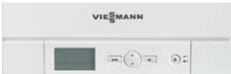
带有集成式诊断系统的控制器

Vitopend 100-W (A1JC) 可提供温度适宜的热热水，为您节省更多空间，当然也可根据需求组合外接换热水箱。