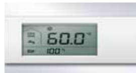
人性化的智能控制显示