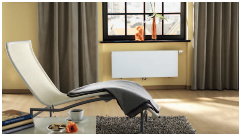
高效平板式散热器

平板式散热器为纯平表面, 光滑高效。可选择多种灵活的接口方式: 通用侧面接口- 4 个侧面接口可用来做同侧或异侧连接。底部接口-可带有内置连杆三通来调节温度, 底部连接隐蔽管路, 节省空间。中央接口-除底部接口功能外, 其采用 CENTARA 技术创造了最佳的室内气候及热能分布