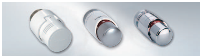
方便调节的温控阀