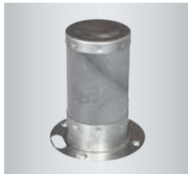
MatriX圆柱型燃烧器实现低排放燃烧