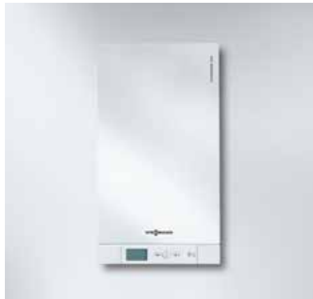
Vitodens 100 CC 高热值冷凝式燃气采暖热水炉