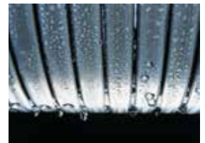
超耐腐蚀的主换热器, 材质钼钛合金不锈钢

无须预留侧面维修空间, 所有部件都可以从前面提取, 方便维修和保养, 省时省力, 还节省维修费用。最后, 所有的设备元件如膨胀水箱、水泵和安全阀出厂时已经预装完毕。