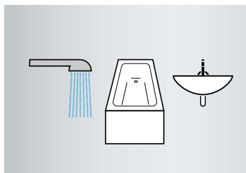
增大功率、热水舒适