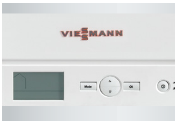
清楚易读的 LED 白光显示屏，完美融入室内设计